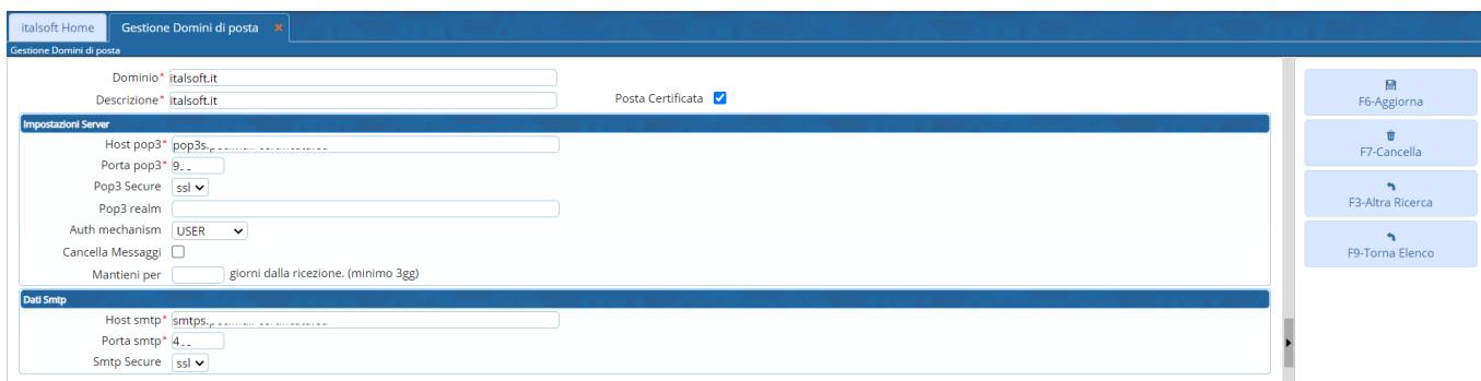
Fig. 4: Maschera per la gestione di un dominio

Apportare le modifiche e cliccare il bottone [Aggiorna] (Fig.4) per salvare i dati aggiornati.