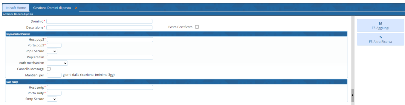
Fig. 3: Maschera per l'inserimento del dominio

Cliccare il bottone [Aggiungi] (Fig. 3) per salvare i dati inseriti.