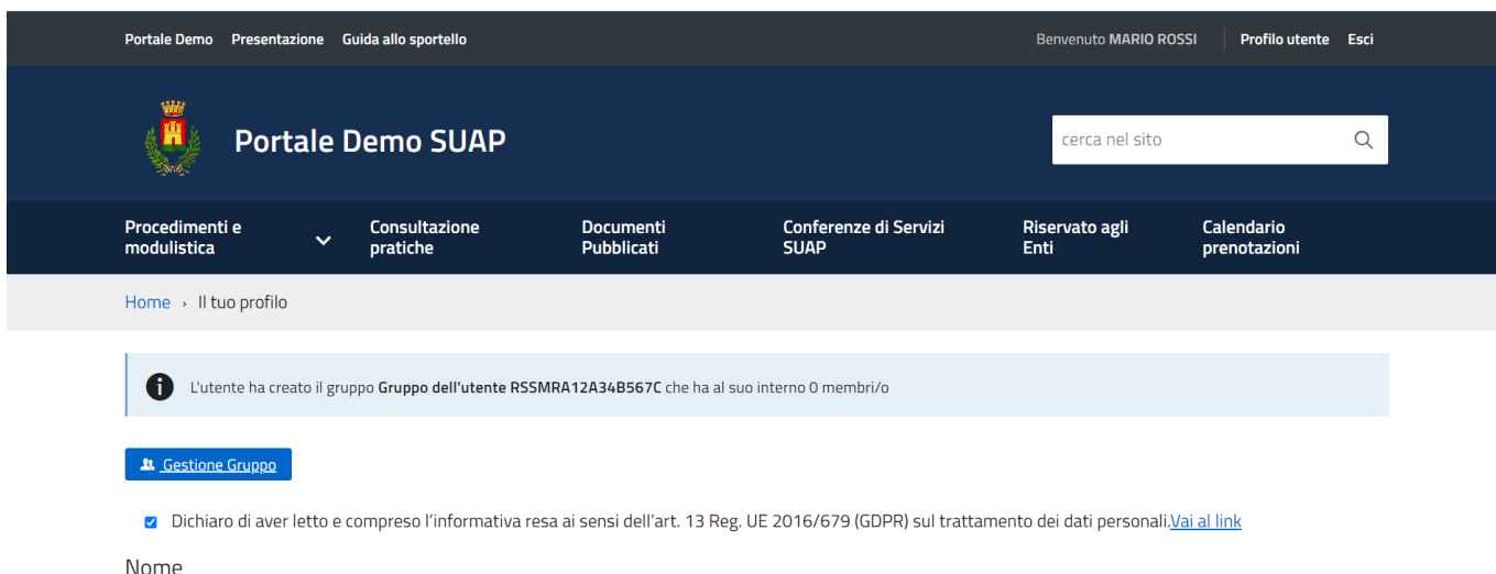
Fig. 3: Schermata area personale