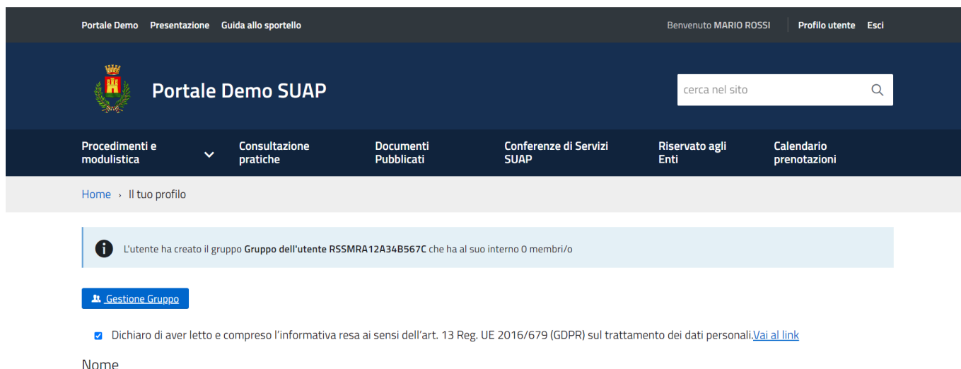
Fig. 3: Schermata area personale