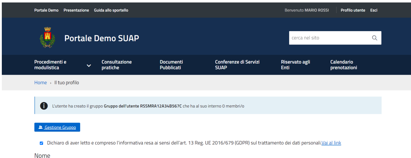
Fig. 3: Schermata area personale