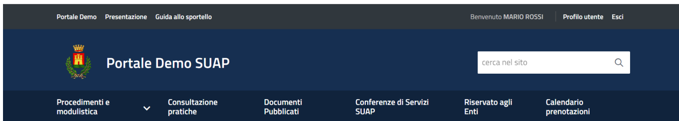
Fig. 2: Schermata dello sportello dopo aver effettuato l'accesso

Cliccare in alto a destra il bottone [Profilo utente] (Fig. 2)