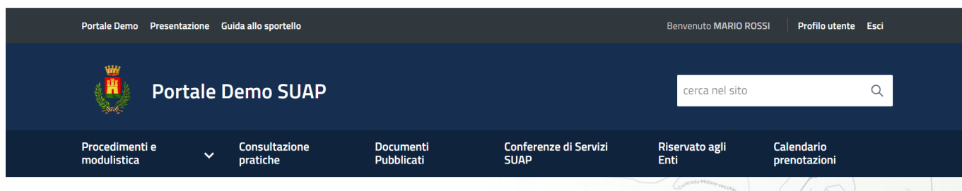
Fig. 2: Schermata dello sportello dopo aver effettuato l'accesso

Cliccare in alto a destra il bottone [Profilo utente] (Fig. 2)