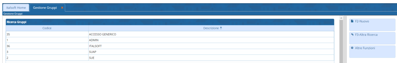
Fig. 2: Elenco dei gruppi