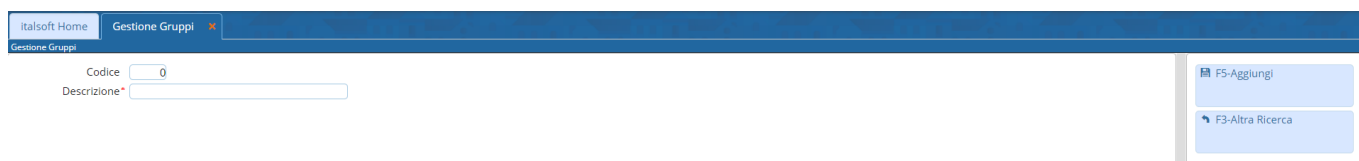
Fig. 3: Maschera per l'inserimento del gruppo

Per creare un nuovo gruppo cliccare il bottone [Nuovo] (Fig. 1), valorizzare il campo “Codice” con il primo numero disponibile ed inserire il nominativo del gruppo nel campo “Descrizione” , cliccare il bottone [Aggiungi] (Fig. 3) per salvare i dati inseriti.