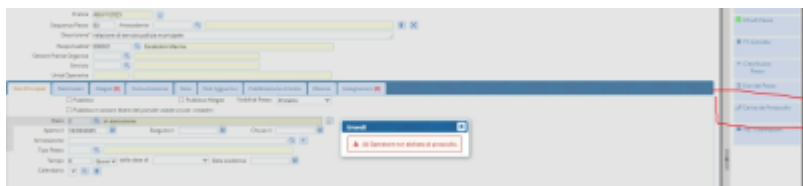
Fig. 1: Maschera per la ricerca di una

La funzione [Carica da protocollo] presente anche all'interno di un passo, consente di importare il contenuto del protocollo appunto nel passo o creando una nuova pratica (la si trova anche nella funzione di ricerca standard). Può capitare che venga restituito il messaggio di errore riportato nel titolo: