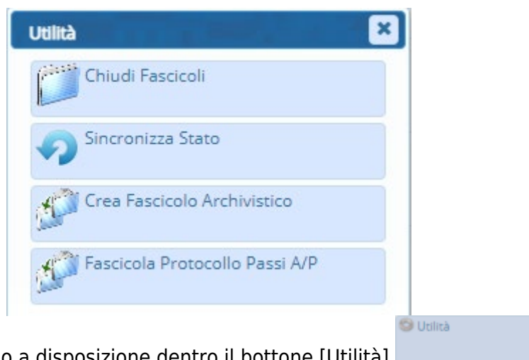
Fig. 1: Comandi che si trovano a disposizione dentro il bottone [Utilità] sulla lista dei Fascicoli su cui effettuare una delle 4 operazioni

Questa funzione si chiamava “Chiusura massiva fascicoli” e consentiva di chiudere con una sola operazione tutti i fascicoli elettronici che venivano estratti con la relativa ricerca. La funzione [40. Fascicoli Elettronici - 70. Utilità - 100. Operazioni Massive Fascicoli] è stata arricchita di tre nuove funzionalità, per la sincronizzazione dello stato fascicolo e per la creazione dei fascicoli archivistici della pratica e per i protocolli all'interno dei passi, non creati nella fase iniziale insieme ai Fascicoli elettronici (Fig. 1).