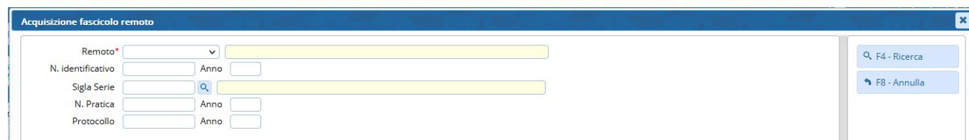
Fig. 2: Ricerca "Da Backend remoto"

La prima fase è cercare la pratica da importare (Fig. 2), scegliere il giusto ente remoto, indicare alcuni dati per individuare la pratica.