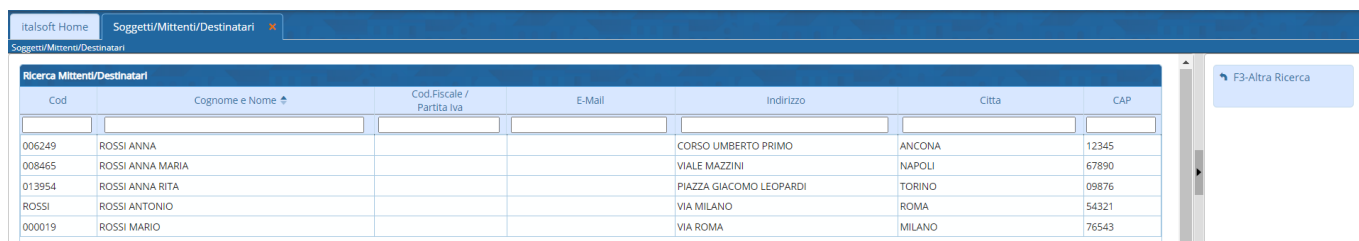
Fig. 2: Elenco dei soggetti/destinatari