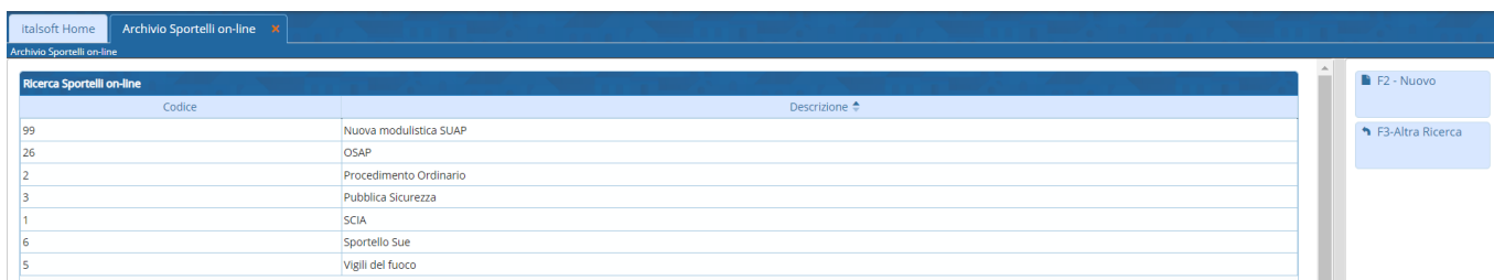
Fig. 2: Elenco degli sportelli online