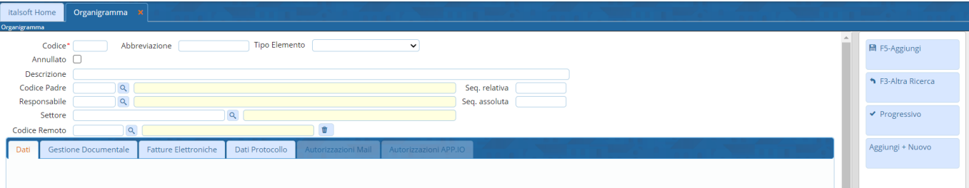
Fig. 3: Maschera per l'inserimento dell'ufficio

Cliccare il bottone [Aggiungi] (Fig. 3) per salvare i dati inseriti e per poter continuare con la compilazione della parte inferiore della maschera.